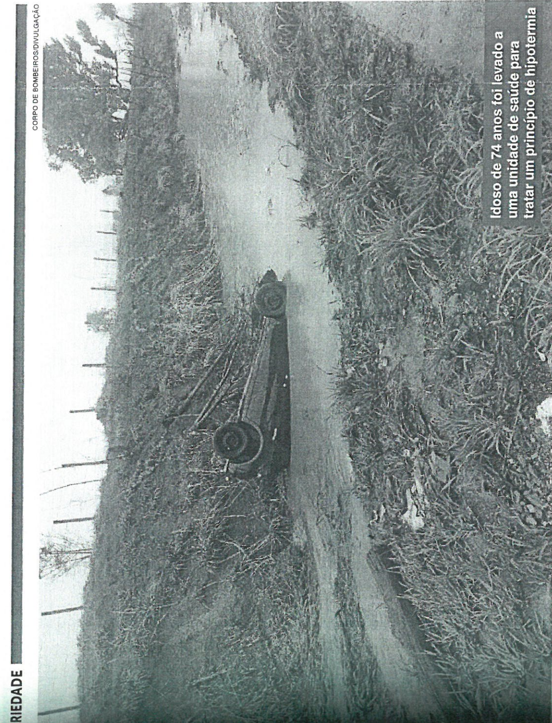
Idoso de 74 anos foi levado a uma unidade de saúde para tratar um princípio de hipotermia